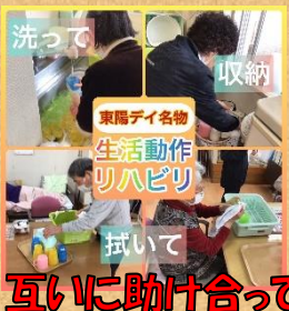
互いに助け合って過ごしています