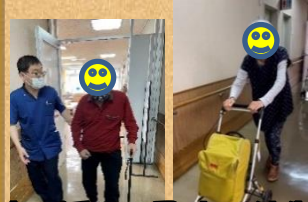
付き添い・見守り体制 各自のペースで歩く

洗濯、お茶入れ、掃除、歯磨きなどこれまでの生活で行ってきたことを、継続して実践していくこと自体がリハビリだという取り組み