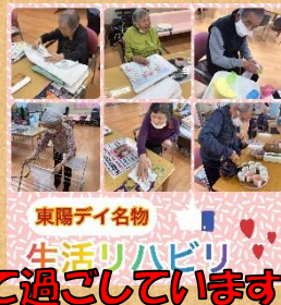
東陽デイ名物 生活リハビリ