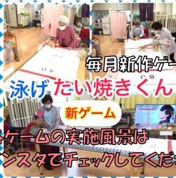
毎月新作ゲームが登場します