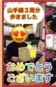
おめでとうございます ございます