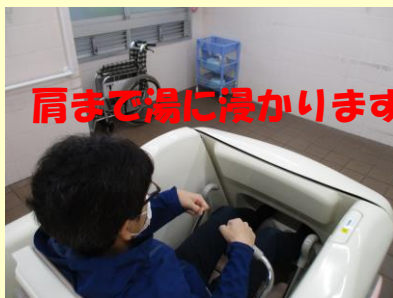
肩まで湯に浸かります