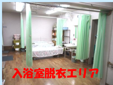
入浴室更衣エリア