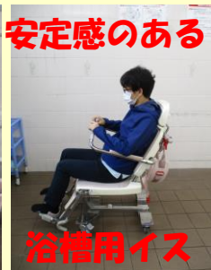
安定感のある 浴槽用イス