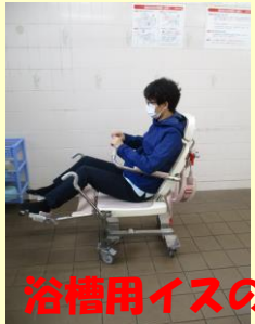
浴槽用イスのまま浴槽内に入ります