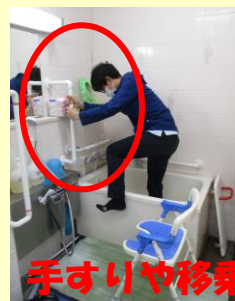
手すりや移乗用ボードを使用します