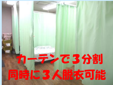
カーテンで3分割 同時に3人脱衣可能