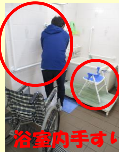
浴室手すりを使用します