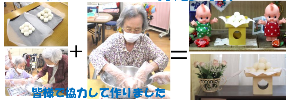
皆様で協力して作りました