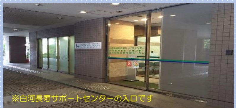
※白河長寿サポートセンターの入口です