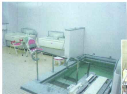
座ったまま入れる個別浴槽とリフト式浴槽

利用者様の状態に合わせ、5タイプの入浴 方法を実施しています。 安心して入浴の時間を過ごしていただけます。