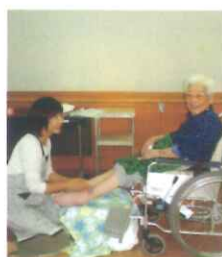
リフレクソロジー