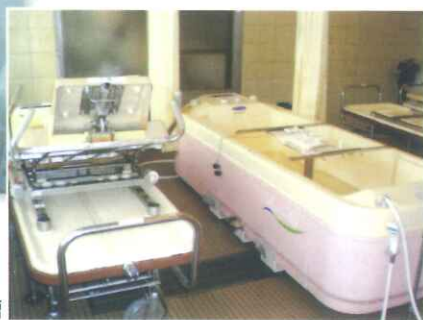
寝たまま入れる浴槽