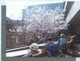
季節ごとにお花見やみかん狩りが楽しめます。