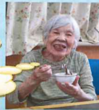
ソフトクリームイベント 利用者様も大満足！