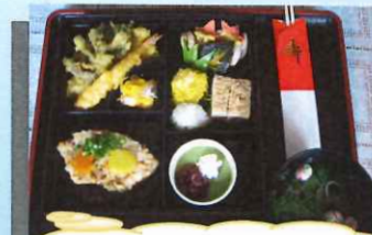
敬老式典 お祝い膳