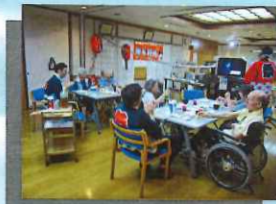
月1回 外出やレクリエーションを企画・開催しております。

ここでは伝えきれない魅力が塩浜ホームにはたくさんあります。ぜひ一度、施設に足を運んで頂けると幸いです(^o^)担当者 が館内の案内やホームでの生活を説明させていただきます。